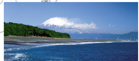
三保から見た富士山