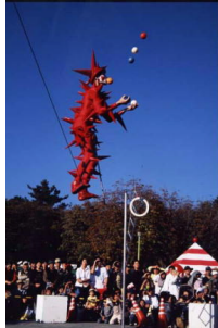
大道芸ワールドカップ in 静岡