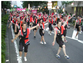
清水みなと祭り(港 かつぱれ総おどり)