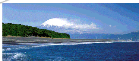
Tanawin ng Mt. Fuji mula Miho