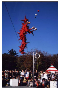
Street performance World Cup in Shizuoka