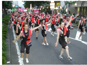
Shimizu Harbor Festival (Kappore Dance)